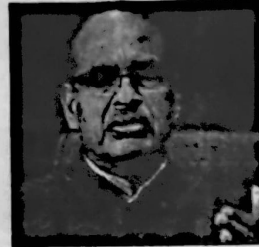
केंद्रीय कृषि मंत्री शिवराज सिंह चौहान

मुख्यमंत्रियों को लिखे पत्र में चौहान ने उनसे उर्वरक उत्पादन और बिक्री को नियमित निगरानी करने के साथ-साथ नकली और घटिया उत्पादों के नमूने लेने और परीक्षण करने को कहा है। उन्होंने कहा, पारंपरिक उर्वरकों के साथ नैनो-उर्वरकों पर जबर्न टैगिंग तुरंत बंद की जानी चाहिए। केंद्रीय मंत्री ने कहा कि दोषियों के खिलाफ लाइसेंस रद्द करने और एफआईआर दर्ज करने सहित सख्त कानूनी कार्रवाई की जानी चाहिए और दोषसिद्धि सुनिश्चित करने के लिए